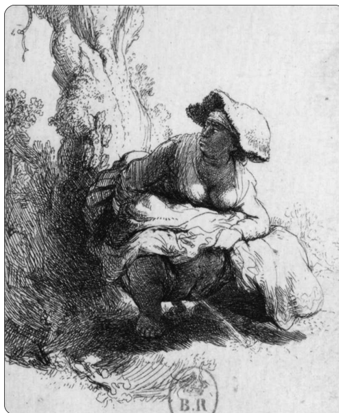
Rembrandt, L'homme qui pisse et la femme qui pisse, eaux-fortes, 1631 B.n.F.